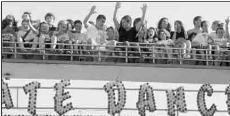
La fête foraine attire beaucoup de jeunes... et de moins jeunes