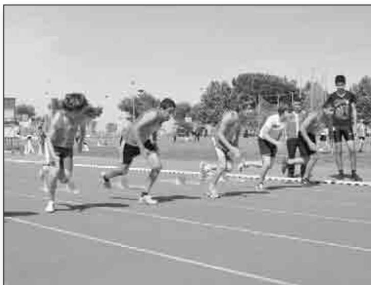
Départ des Benjamins