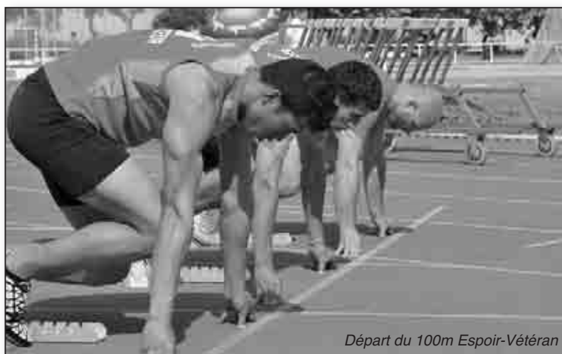
Départ du 100m Espoir-Vétéran

B eaucoup de monde au Complexe Sportif de Montesoro, autour de la Piste d'Athlétisme pour des Championnats de Haute-Corse qui ont tenu toutes leurs promesses. Le Comité Départemental bénéficiant d'un soleil éclatant, dont une légère brise venait atténuer les ardeurs, aura réussi à faire du samedi 12 mai 2012 un moment fort de ses activités. Les Ecoles d'Athlétisme invitées à la fête apportaient la note de renouveau pour une discipline en pleine expansion.