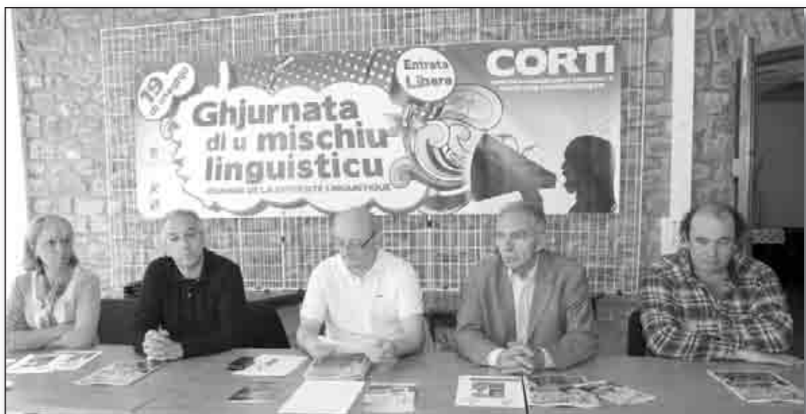
Lors de la conférence de presse qui s'est tenue au centre CPIE de Corte

Il s'agit du premier marché de producteurs de Pays organisé en Haute-Corse, dont le label indique la richesse et la diversité des terroirs, en favorisant les échanges entre producteurs et consommateurs.