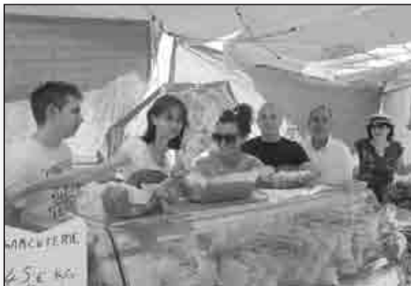
Fromages et charcuterie du Niolu au stand Roba Nustrale