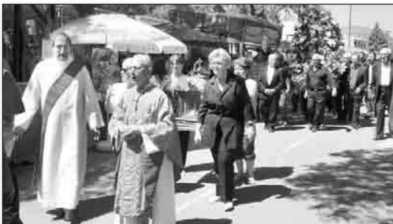
San Pancraziu est avant toute chose une fête religieuse, considérée comme telle