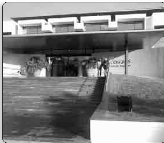
Le Palais des Congrès d'Ajaccio

Pour plus de renseignements, contacter le 04 95 45 01 64 ou le 04 95 45 01 66 .