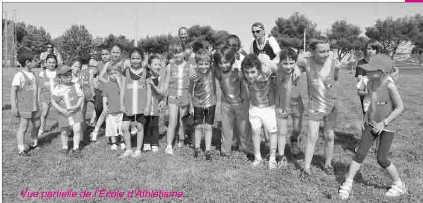
Vue partielle de l'École d'Athlétisme